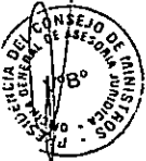
FERNANDO ZAVALA LOMBARDI Presidente del Consejo de Ministros